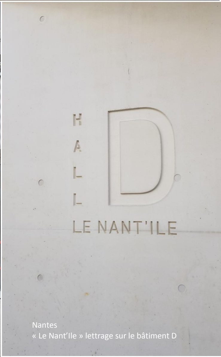
Nantes « Le Nant'île » lettrage sur le bâtiment D