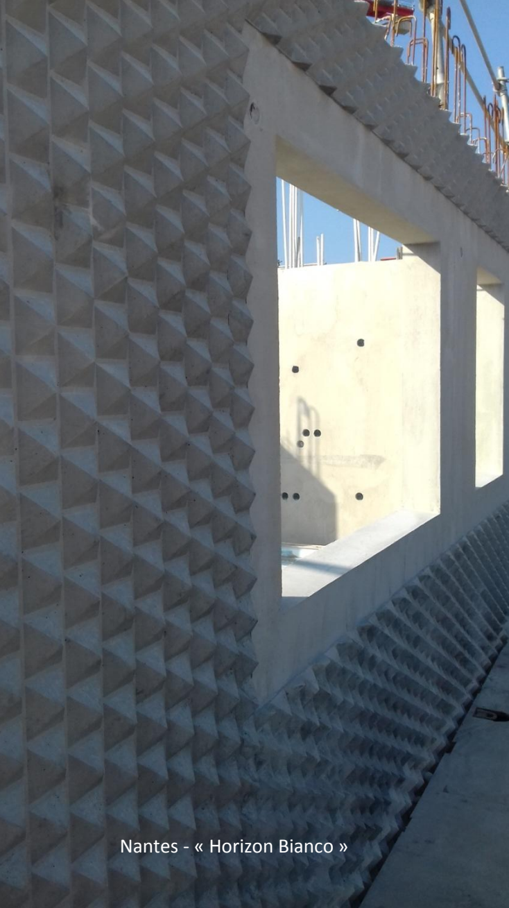
Nantes - « Horizon Bianco »