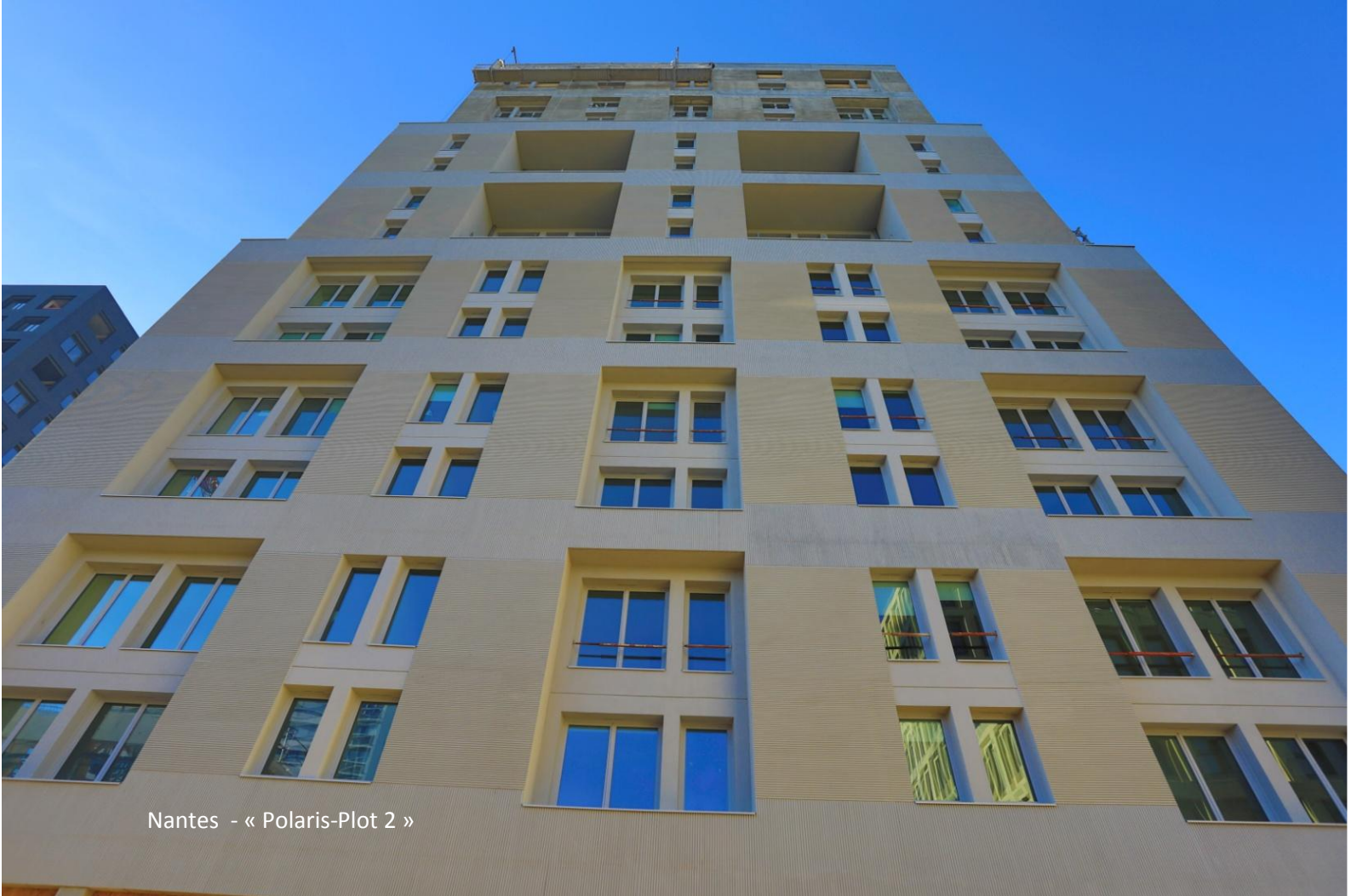
Nantes - « Polaris-Plot 2 »