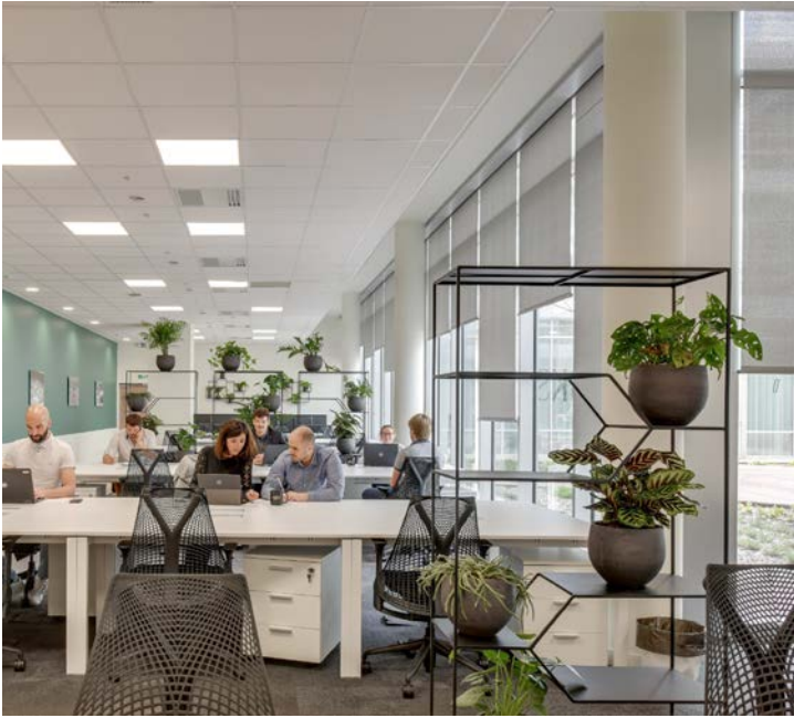
Whoorks Bordeaux