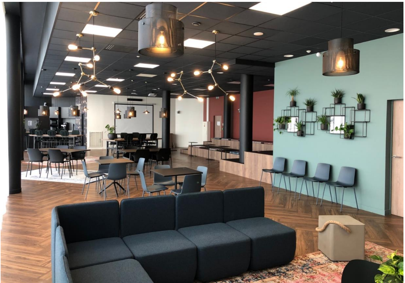
Whoorks Bordeaux