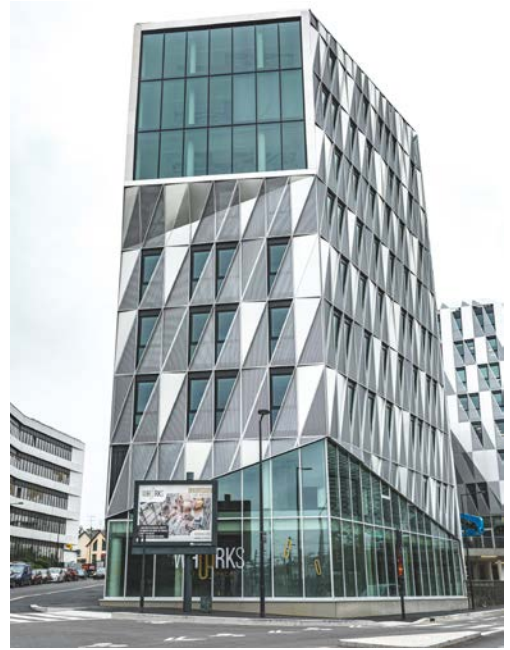
Whoorks Rennes